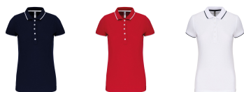
navy/white/red red/white/navy white/navy/white