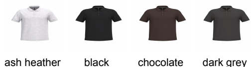
ash heather black chocolate dark grey