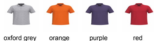
oxford grey orange purple red