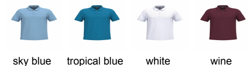
sky blue tropical blue white wine