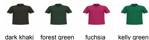
dark khaki forest green fuchsia kelly green