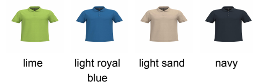
lime light royal blue light sand navy