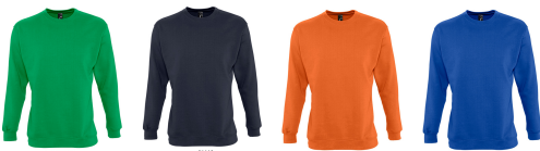
kelly green navy orange royal blue