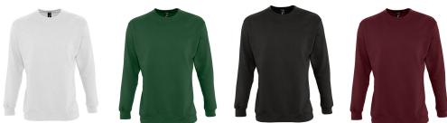
ash (heather) bottle green black burgundy