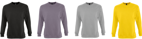
deep charcoal flannel grey (solid) grey melange gold